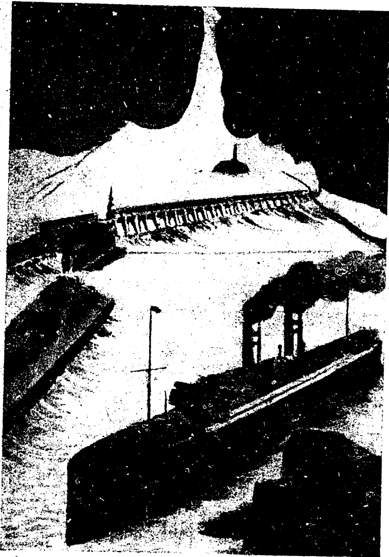
אלגעמיינער אויסזען פון דניעפערבוי.

דניעפערבוי איז נאך נישט אויסגעבויט, אָפּער ער גיט שוין ענערגיע. ער האָט שוין געגעבן ענערגיע, געגעבן אַנלאָד די יונגע לענינער צום קאמף, צו ארבעט. דאָס איז זייער צוקונפט. אונטער די וואגאַנעס האָבן פריילעך געקלאפט די רעדער.